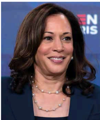
Trump e Harris – visões de mundo diferentes, mas mesmo objetivo: chegar à Casa Branca

O candidato republicano à Presidência dos Estados Unidos, Donald Trump, sinalizou apoio à proposta do ex-candidato independente Robert F. Kennedy Jr. de remover flúor da água. Candidata do Partido Democrata e vice-presidente americana, Kamala Harris afirmou, em suas redes sociais, neste domingo (3), que já votou por correio para a disputa presidencial.